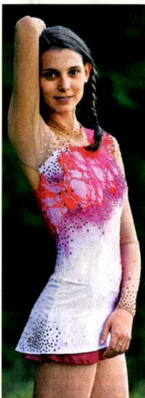
Vlastní model Ukázka z tvorby.

Na každou sestavu gymnastky oblékají jiný dres, což může být někdy pro rodiče finančně náročnější. Hodně záleží na použitém materiálu a látka rozhodně není to nejdražší. Tím je samotná práce, malování a také ozdobné kamínky, které někdy představují až polovinu z konečné ceny. Kromě obvyklých litých používá také broušenou bižuterii Preciosa a nejčastěji její dílo zdobí kamínky Swarovski. „Dá se udělat krásný dres pro malé holčičky do dvou tisíc korun, ale jsou i takové, které stojí třeba i šest